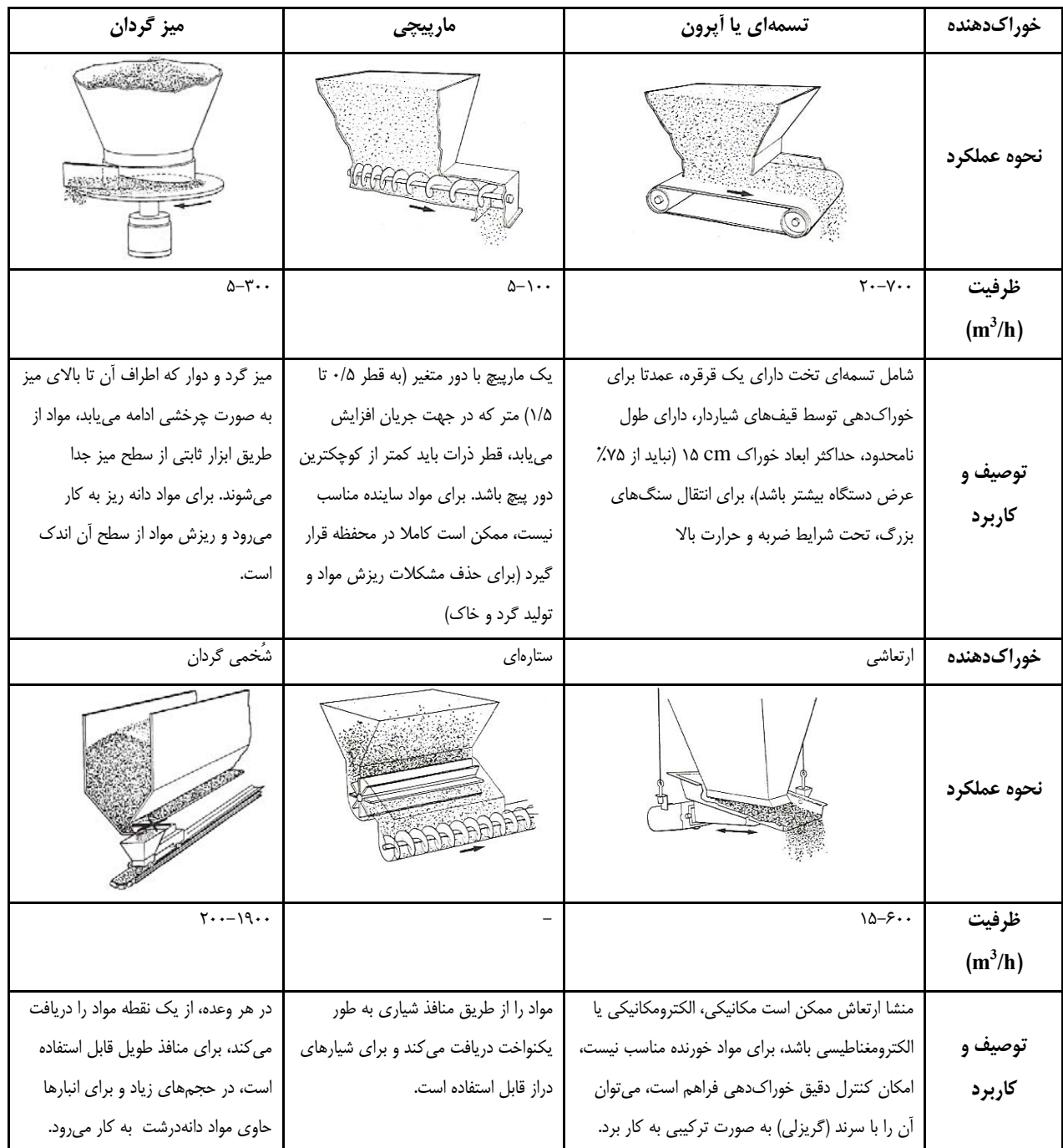
جدول ۳-۲- انواع خوراک‌دهنده‌های مواد در جریان خشک، مشخصات و کاربرد آنها